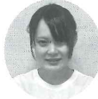
神 彩香 デイサービスセンター ラポール