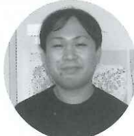
久米田 心 よりあい拋 わらび