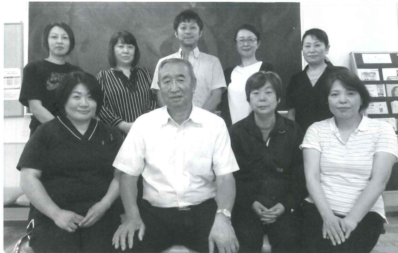
平成12年に社会福祉法人 拓心会が創立し、今年20周年を迎えました。創立当初より勤務され活躍されてきた皆様です。これからも宜しくお願いいたします。