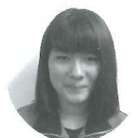
寺山 未来 さかえデイサービス センター