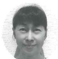
小笠原真由美 ESCORT ケア ここあん