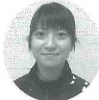
北川 悠永 デイサービスセンター ラポール